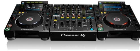
DJ SET & BOOTH

Villa Westend beschikt over een eigen DJ booth incl Pioneer CDJ 2000 NXS DJ set. Onze locatie is volledig uitgerust met een professioneel luissprekersysteem van Lynx Benelux.