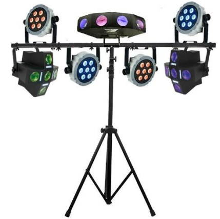
LICHTSET / LICHTSHOW

Villa Westend beschikt over een professionele DJ lichtsysteem toren. Deze kan ingehuurd worden voor een gave lichtshow ter ondersteuning van de DJ.