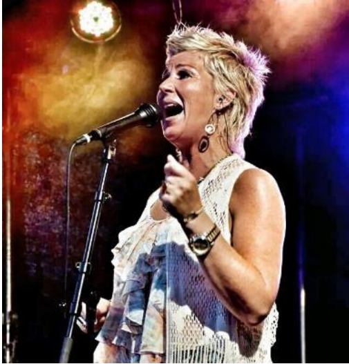
FUNKY DIVA EZZ

Hebben jullie al gedacht aan het entertainment op jullie bruiloft? Wij kunnen vanuit Villa Westend een divers entertainment aanbieden onderstaand een voorbeeld. Jullie zijn ook vrij om zelf een DJ en/of band te regelen. Op aanvraag kan gebruik gemaakt worden van een LED scherm van Villa Westend (eigen laptop meenemen).