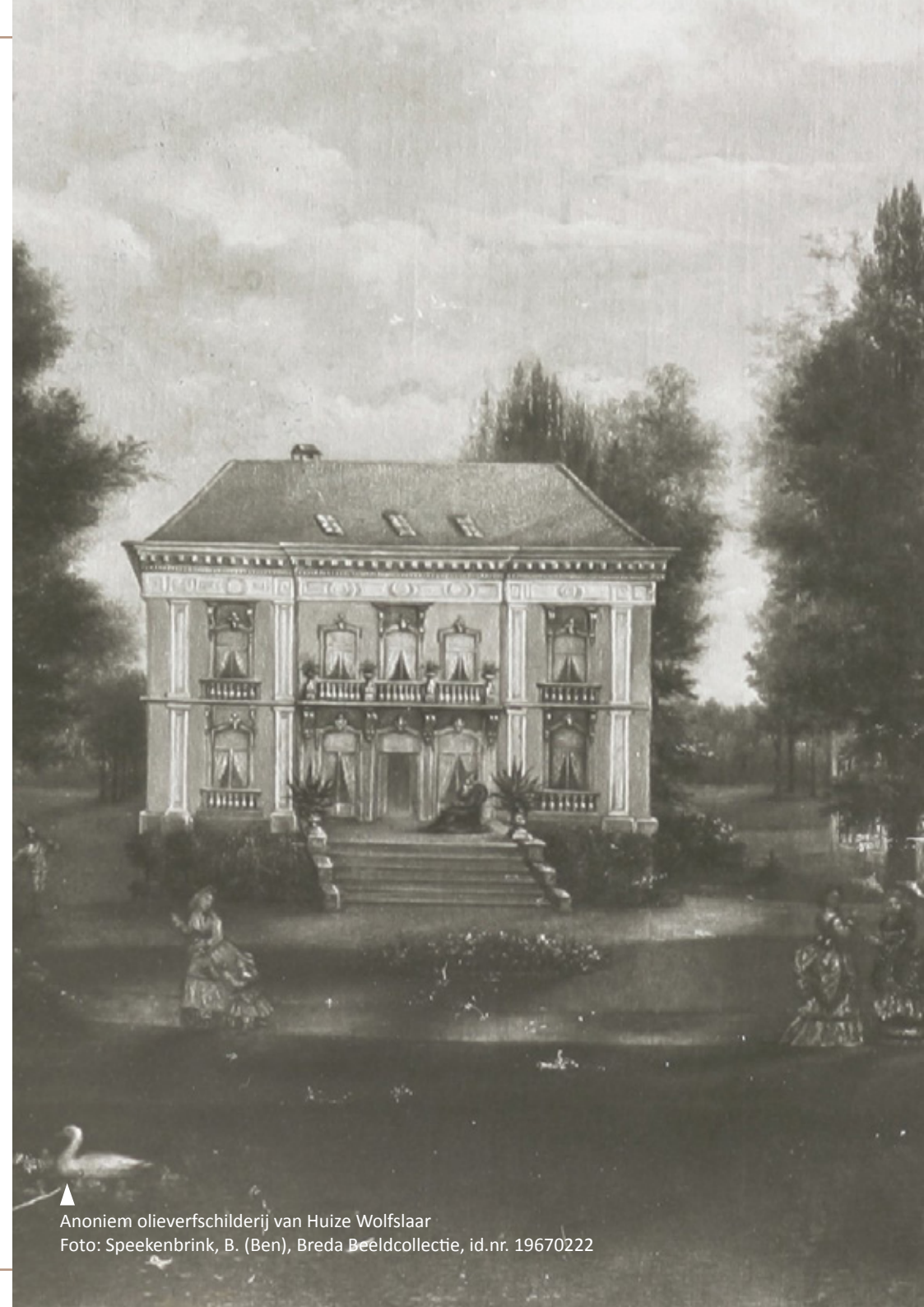
▲ Anoniem olieverfschilderij van Huize Wolfslaar Foto: Speekenbrink, B. (Ben), Breda Beeldcollectie, id.nr. 19670222