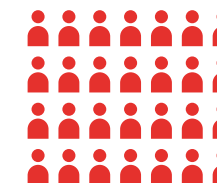
Receptie | Feest